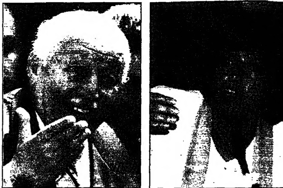
انقرة - من هيفيه كوترويه

بريد ان استجيب جمعيات دينية قريبة منه من العبادات المخلقة، التي لا تقل عن عشرة ملايين دولار، الناجمة عن بيع هذه الجلود في مجال الجسد.